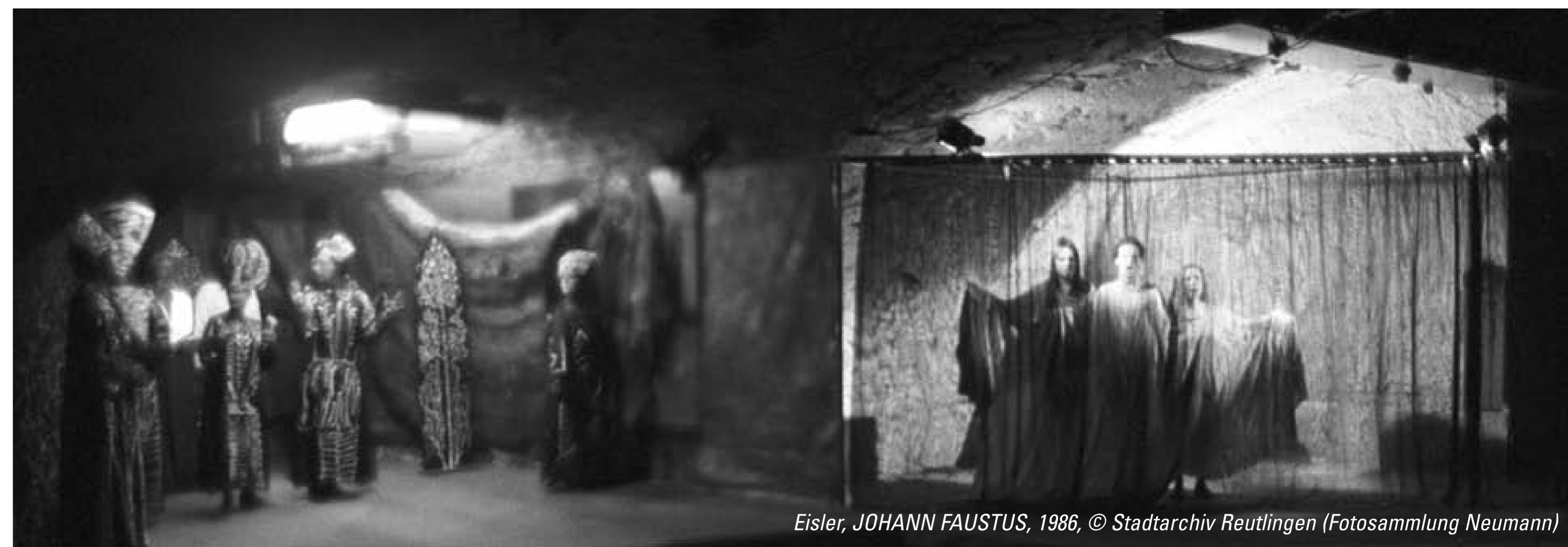
Eisler, JOHANN FAUSTUS, 1986

Aus der GEA-Kritik von Monique Cantré vom 02.11.87