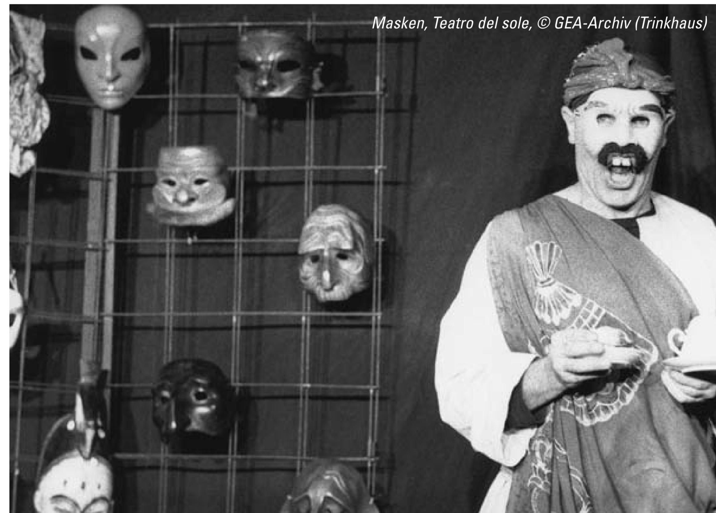
Masken, Teatro del sole