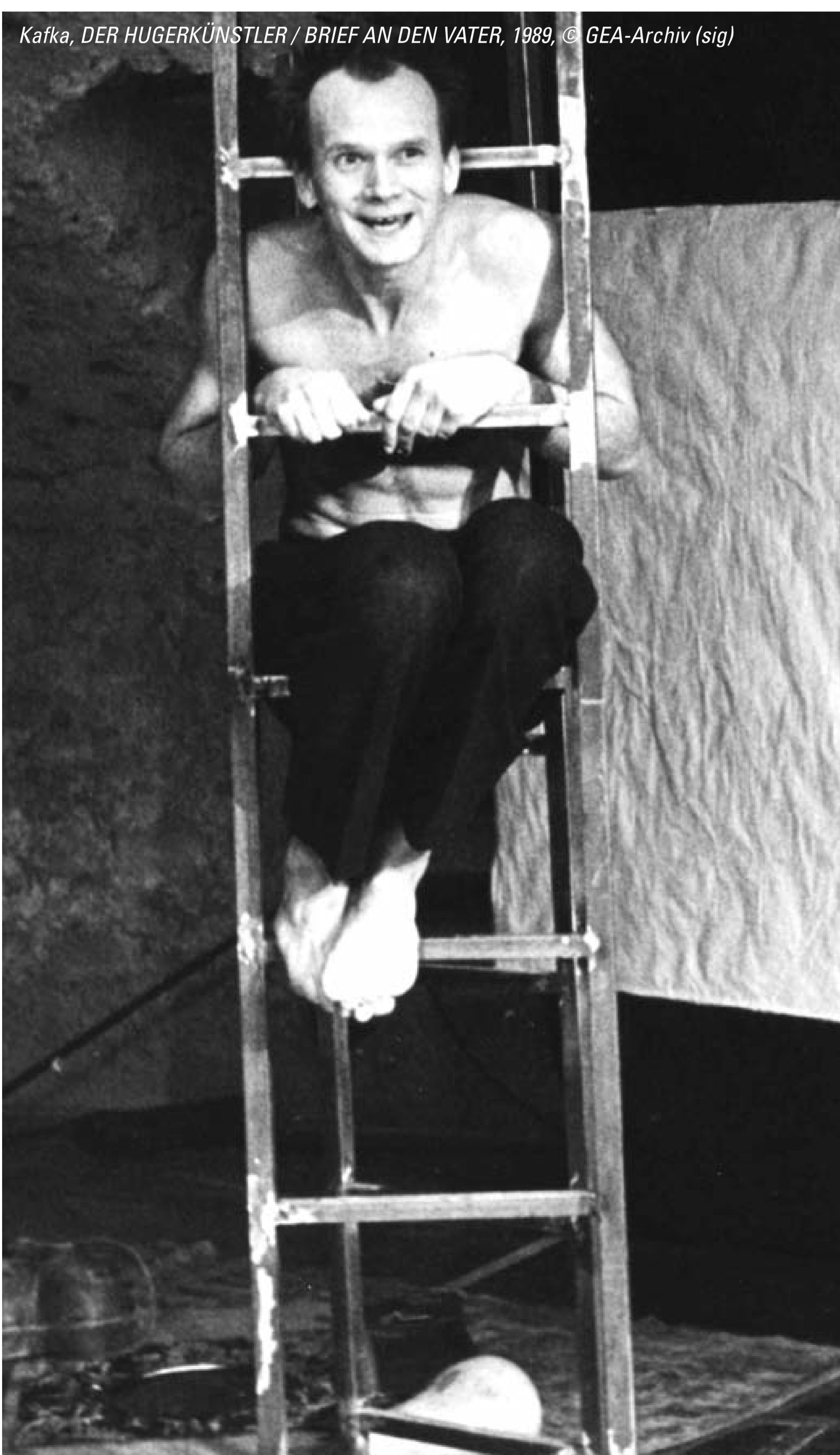
Kafka, DER HUNGERKÜNSTLER / BRIEF AN DEN VATER, 1989, © GEA-Archiv (sig)