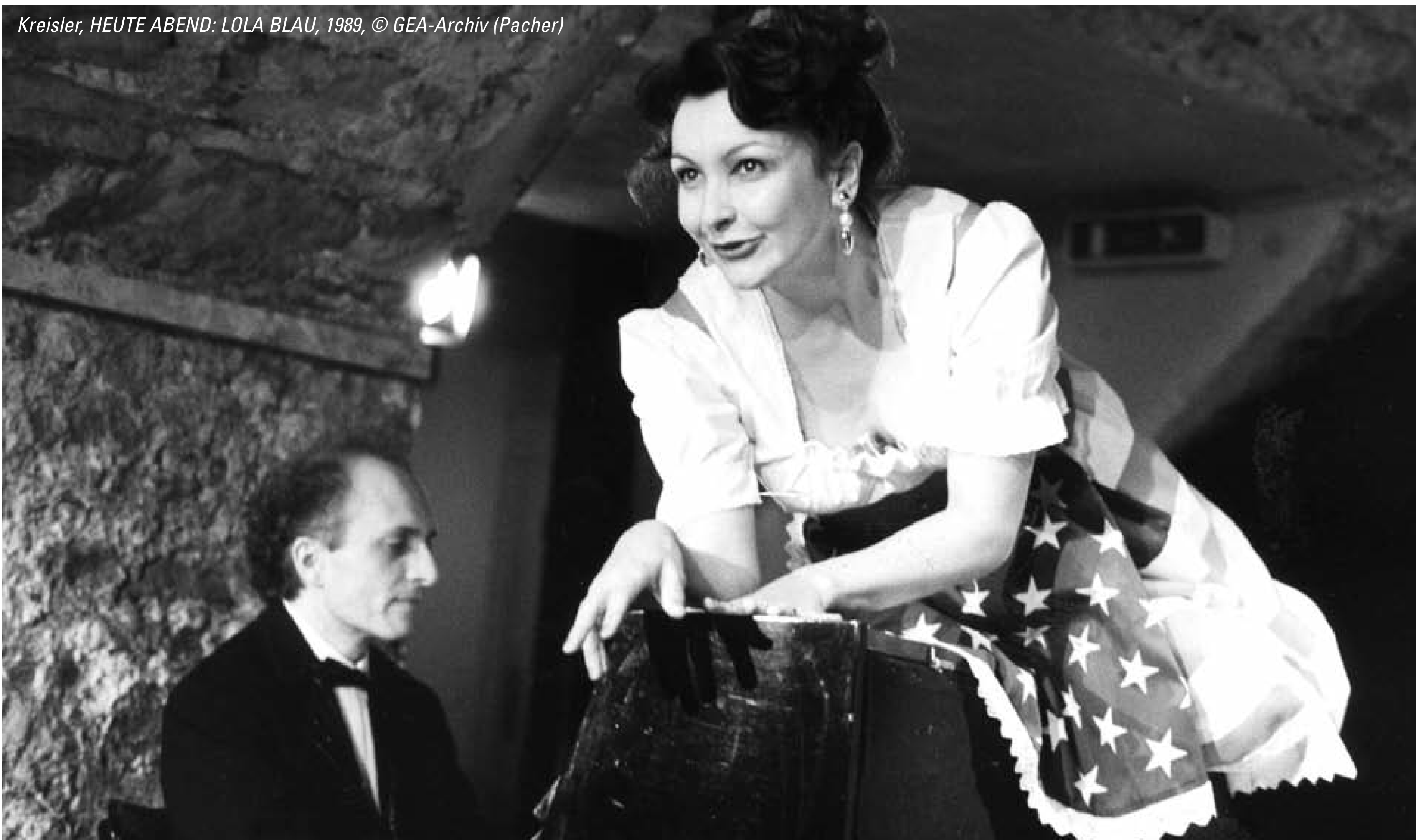
Kreisler, HEUTE ABEND: LOLA BLAU, 1989, © GEA-Archiv (Pacher)