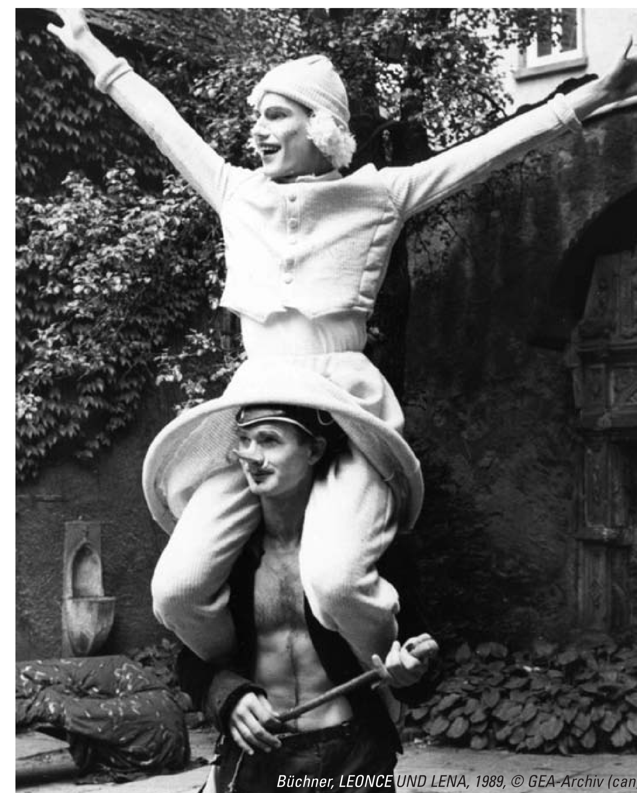
Büchner, LEONCE UND LENA, 1989, © GEA-Archiv (can)

Aus der GEA-Kritik vom 03.06.89 von Monique Cantré