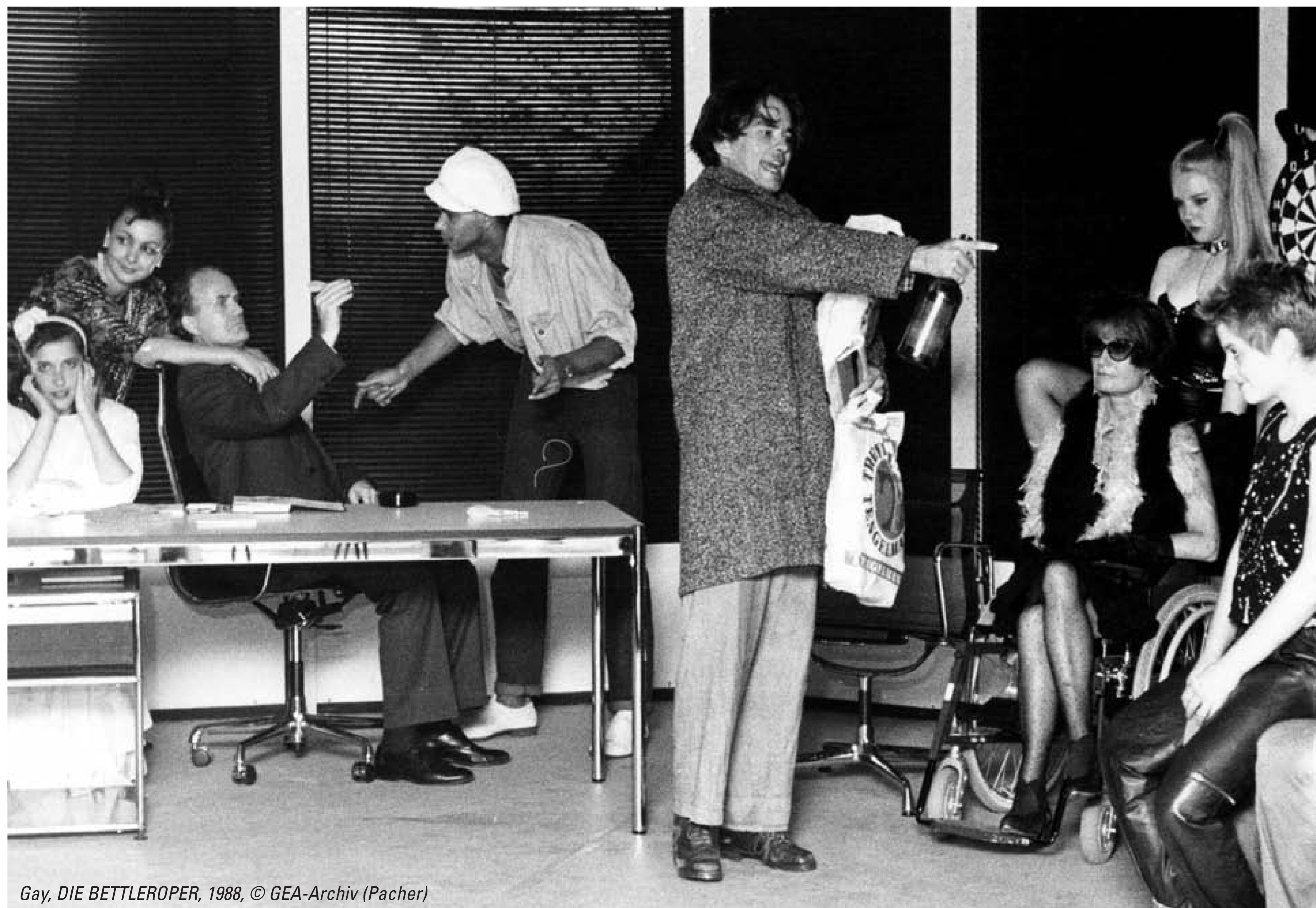
Gay, DIE BETTLEROPER, 1988, © GEA-Archiv (Pacher)

Später leitete sie mehrere Jahre das Wolfgang-Borchert-Theater in Münster und führte u. a. auch an der Oper Aachen Regie.