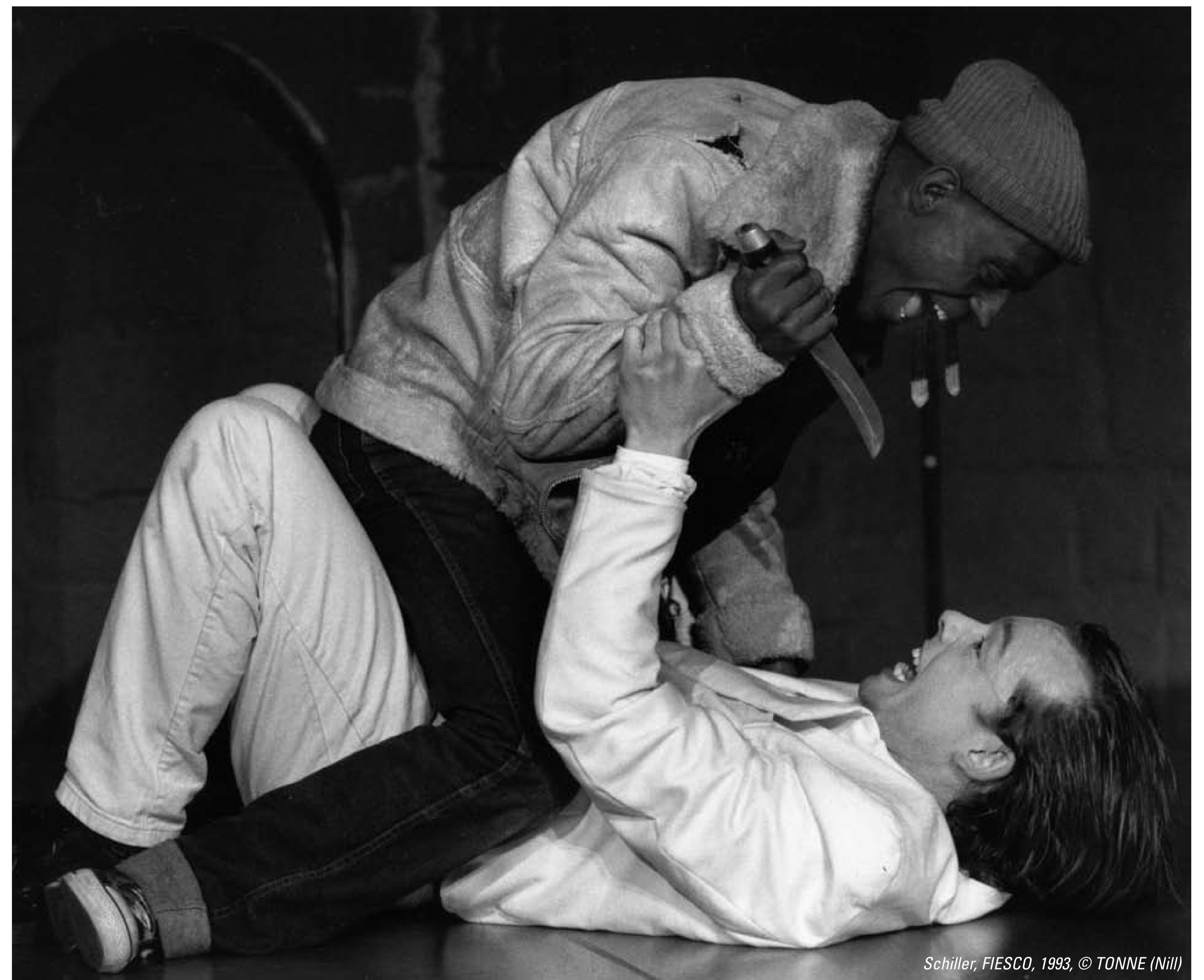
Schiller, FIESCO, 1993