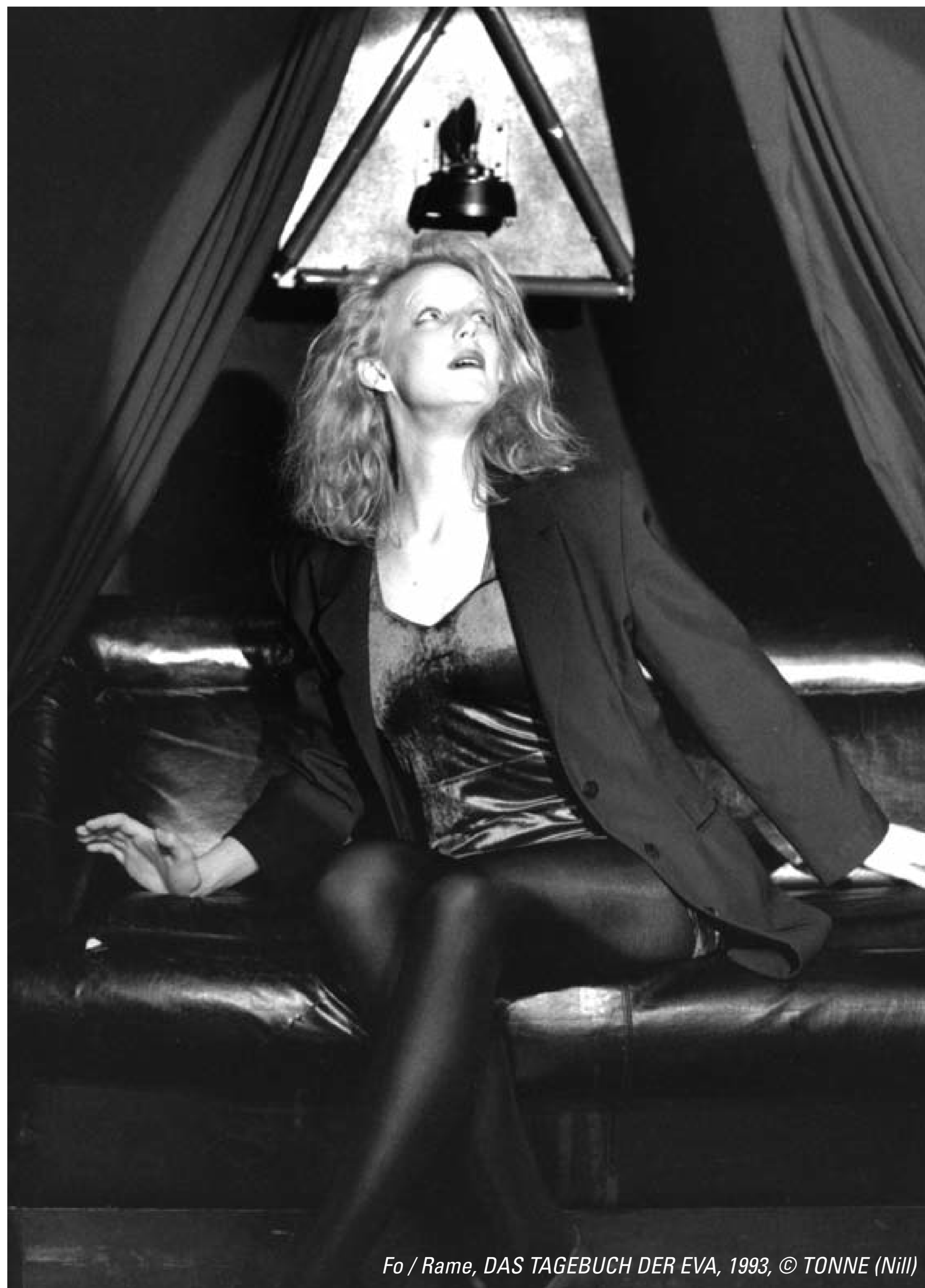
Fo / Rame, DAS TAGEBUCH DER EVA, 1993, © TONNE (NIII)

Das Theater hatte plötzlich mit gewaltigen finanziellen Einbußen zu kämpfen und musste weitere Rücklagen angreifen. Die Arbeit ging danach unter großer Anspannung der Kräfte weiter, aber Weber, der schon 1992 von der TONNE wieder weg gewollt hatte, bewarb sich schließlich für den unvermutet frei werdenden Intendantenposten am LTT. Er war dort ab 1995 Intendant und wechselte 2002 als Schauspielregisseur an das Badische Staatstheater Karlsruhe.