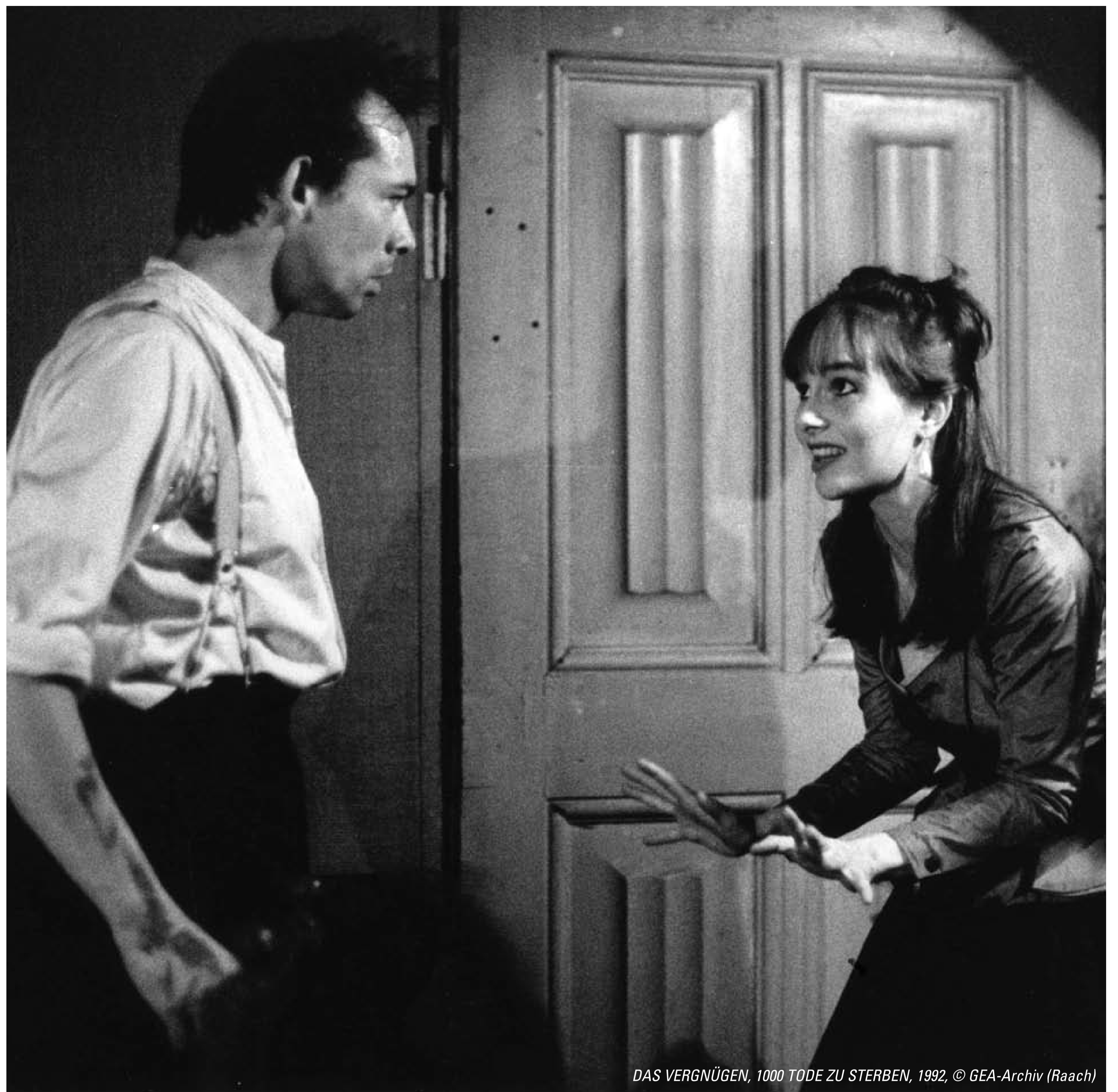
DAS VERGNÜGEN, 1000 TODE ZU STERBEN, 1992