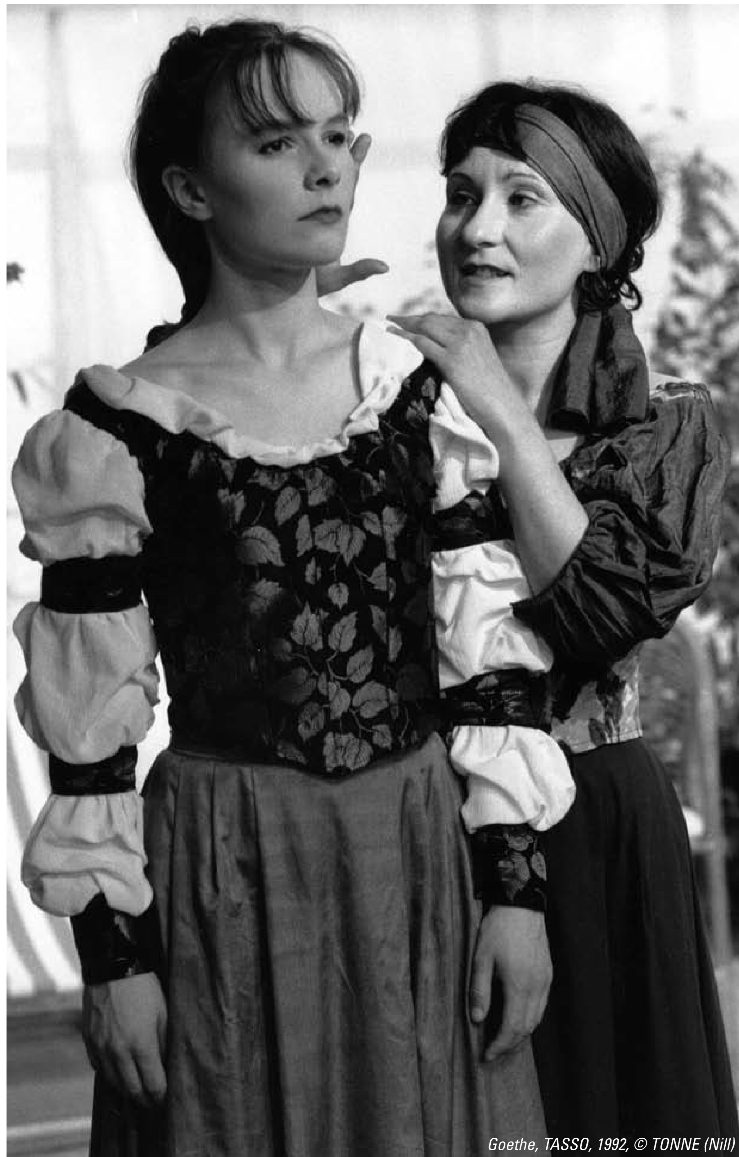
Goethe, TASSO, 1992