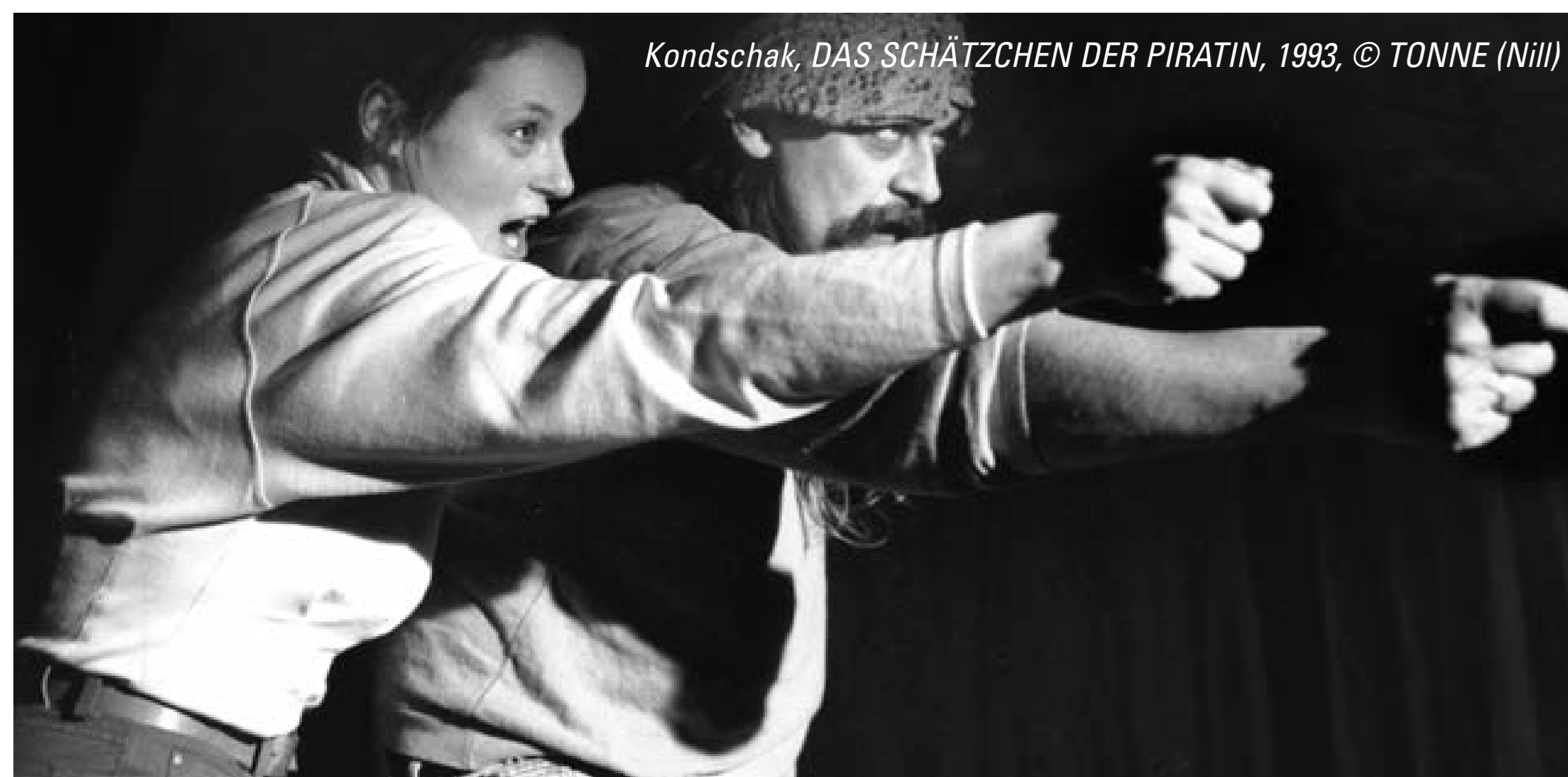
Kondschak, DAS SCHÄTZCHEN DER PIRATIN, 1993, © TONNE (Nilli)

„Neu zu begehren, dazu verhilft die Lust der Reise.“ Dieser gute Gedanke von Ernst Bloch soll unser Leitmotiv sein für die erste Spielzeit des neuen Ensembles im THEATER IN DER TONNE. Wir möchten Sie, unser Publikum, einladen, mit uns auf eine Reise zu gehen – eine Theaterreise in die Fremde: in unbekannte Geschichten, vergangene Zeiten und vielleicht zukünftige Möglichkeiten. Vielleicht gewinnen wir gemeinsam einen anderen Blick auf das vermeintlich Bekannte.